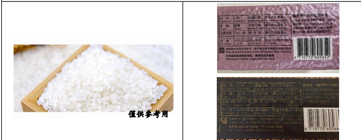
3. 未包裝產品內容物