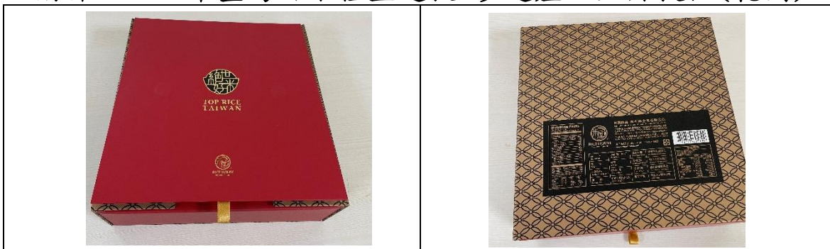
1. 完整包裝產品(禮盒外觀)正反面