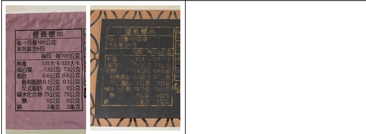
5. 包裝之營養標示(文字應清晰)