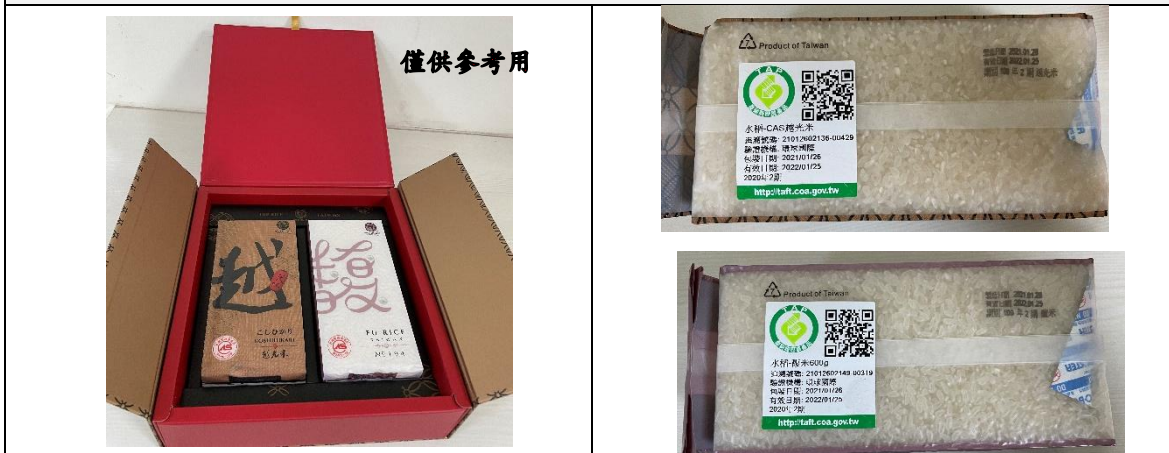
2. 完整包裝產品(內包裝)正反面